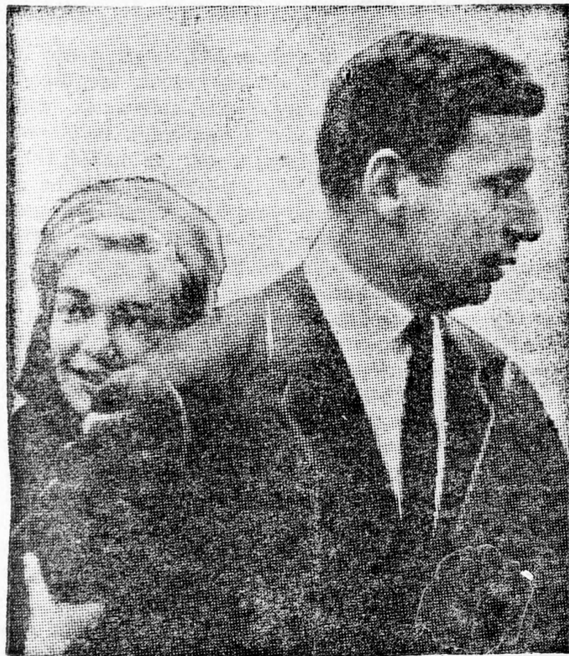
YVES MONTAND és SIMONE SIGNORET

Marilyn Monroe halála óta több újságíró is szerette volna megszólaltatni Yves Montandot, akinek közvetlenül, vagy közvetve úgy vélik, hogy része van a tragédia kifejlésében. Montand azonban a legnagyobb elővigyázattal kerül el az újságírókkal való találkozást és kerekén megtagad minden olyan választ, amit Marilyn Monroevall kapcsolatosan kérdeznek tőle.