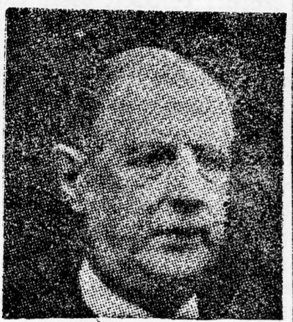
CHARLES DE GAULLE

A CNR (jól jegyezzük meg a nevet, mert a jövőben sokat fogunk hallani róla) másik vezetője, az ugyancsak külföldön tartózkodó Jacques Soustelle. Soustellet nem lehet a szélsőjobboldal egyetlen más vezetőjéhez sem hasonlítani. Nagykulturájú, magas