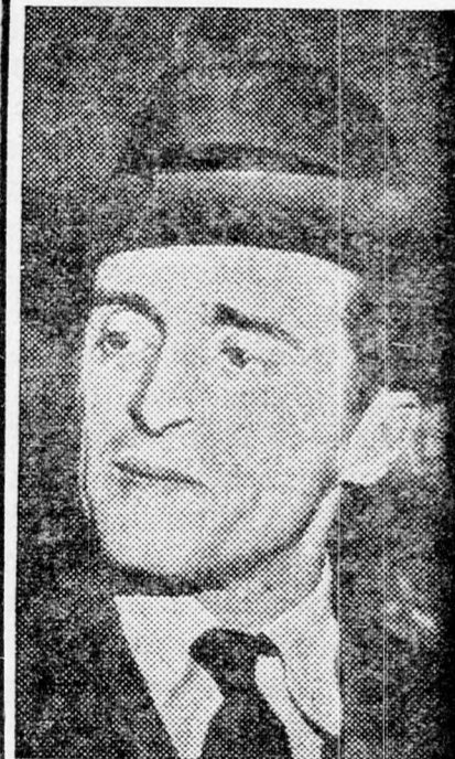
René Clair akadémikus a francia filmkultúra vezetője