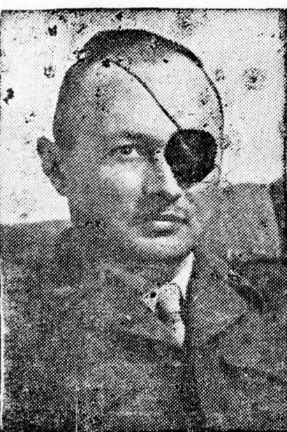
Mose Dáján: „Banán vagy diplomácia?”

Itt, ebben a „leosztásban” Mose Dáján tábornok, a Szináj hadjárat hőse a vezér. A londoni Jewish Observer néhány héttel ezelőtt terjedelmes cikket szentelt farmok kérdéseivel foglalkozik. Nem kifejezetten hadvezérhez illő munkakör. Mose Dáján nem is érzi jól magát a földművelésügyi miniszter székében. Sok baja van. A szárazság sújtotta veteránok, a mezőgazdaság sokrétű problémái és a települések különböző nehézségei, — egyre több terhet raknak vállaira. Vitán felül áll, hogy Mose Dáján nemcsak a Mápáj, de az egész ország egyik letehetsége, legdinamikusabb közéleti figurája. A kulisszák mögött tudott dolog, hogy Mose Dáján a külügyminisztérium felé tekint fokozódó érdeklődéssel. Biztonsági, honvédelmi téren ugyanis már a legmagasabb régiókba jutott el és a vezérkari főnök hivatalának átadása után csakis a hadügyminiszteri szék jelenthetett volna számára előrehaladást. Ezt azonban változatlanul maga Dávid Dávid Ben Gurion tartja kézben, aki mellett hűséges bizalmi embereket, — a fegyvervásárlások terén hervadhatalan érdemeket szerzett kitűnő adminisztrátor, — Simon Perez áll.