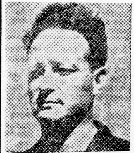
Jigál Alon: „Vissza az egységhez...”

Volt idő, amikor Dájánban látták Ben Gurion utódját a miniszterelnöki székben. Ugy tűnik, az utóbbi időben már nem jegyzik ilyen magasan Dáján részvényeit. A náhálali szűzpolitikus már nem foglalja el azt a szerepet az ország sorsát irányító, szűz, tényleges „árnyékormányban”, amelyet nem is olyan régen, a Lávon-ügy idején még betöltött. Lévi Eskol a Mápáj „kettős számú” embere. Ma benne látják az utódot. Neki sikerült a legszélesebb támogatást felsorakoztatnia maga mögött. Ez azonban távolról sem jelenti azt, mintha a Mápáj-ban belül már végetért volna a belső harc. Nyilvánvaló, még sok összecsapás lesz a sorában, amíg kialakul az egységes vezetőréteg.