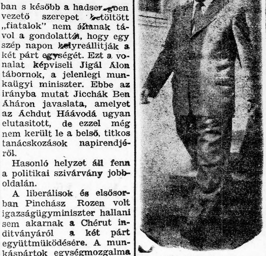
Pinchász Rozen: „Külön utakon!”

Ha igaz a liberálisok érvelése, hogy a Mápáj uralmának megdöntésére és nem pedig a vele való szövetségre törekednek, úgy