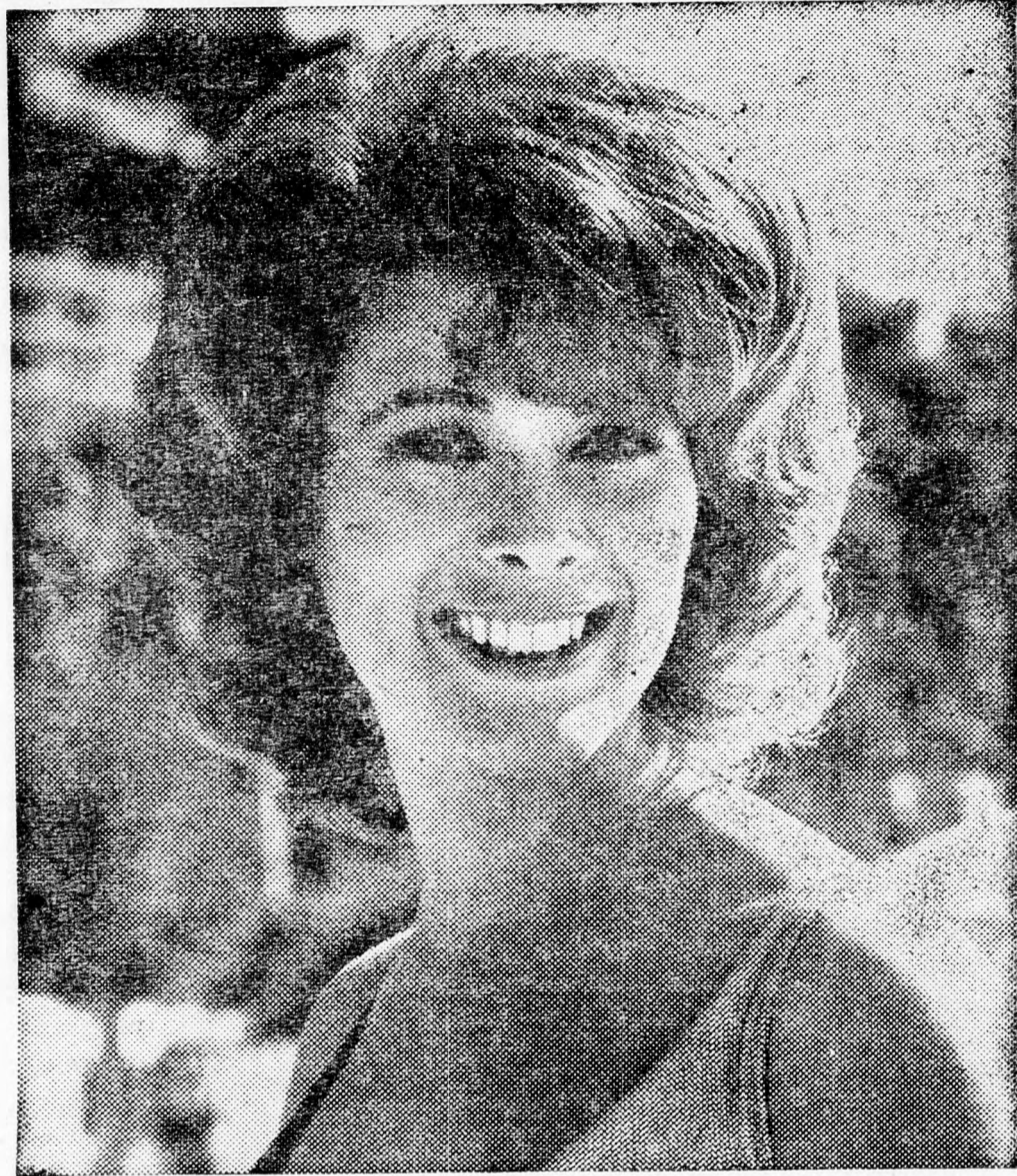
JILL ST. JOHN

A felfelé igyekvők, a szépsége és így az amerikai sztárjelöltek között jó helye van Jill St. Johnnak, aki olyannak mérvéről az olvasó a mellékelt kép alapján is meggyőződhetik.) Liz Taylornál szebbnek