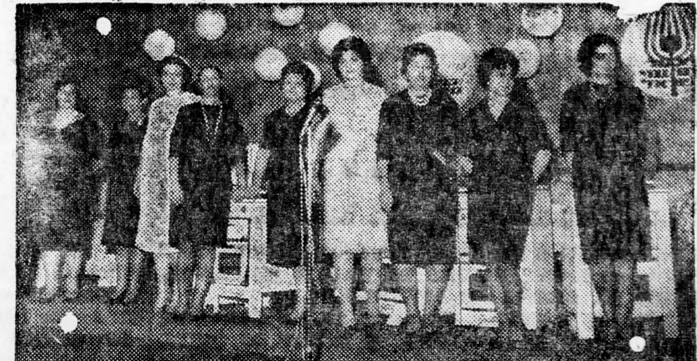
Kilenc asszony estélyi ruhában

Mint a konyhakirálynő esetében — az Ön konyhája is ragyogóan tiszta marad, ételei ízletesek és egészségesek lesznek, munkáját kevesebb fáradsággal végzi — de csak ha villanyon főz.