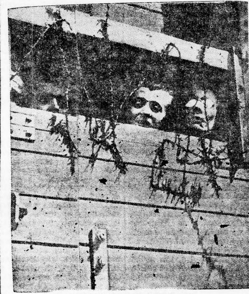
A DEPORTÁLÓ VAGONBAN