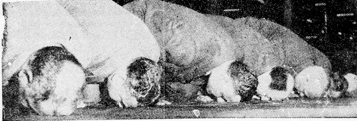
(A képen balról a harmadik Abdul Nasszer) Nasszer és kabinetjének tagjai imádkoznak

az angolokat a jemeni kormány ellen. Egyiptomi repülőgépek szauidi városokat bombáznak és fegyvereket dobnak le a szauidi sivatagba. Szaudia fővárosában, Riadban Feisal herceg a miniszterelnök kijelentette: „Elfogyott a türelmünk. Tudja meg mindenki, hogy nem félünk a háborútól.” Nasszernek egy másik