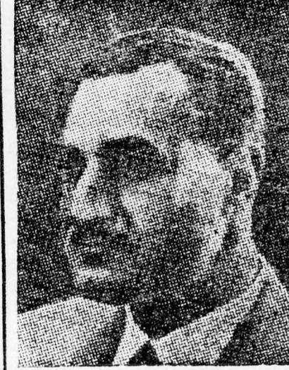
NASSZER — Izraél ellen tör

Az El Achbár arról is tud, hogy április másodikán iraki gazdasági küldöttség érkezik, amely Kairóból Algírba folytatja útját. A küldöttség a három ország közötti kereskedelmi kapcsolatok szorosabbra fűzéséről fog tárgyalni.