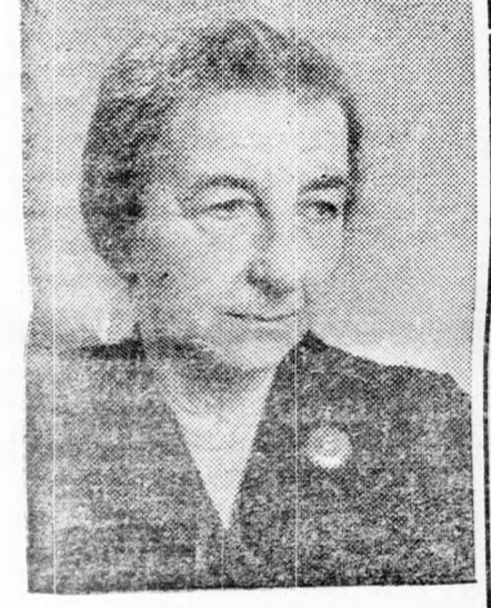
GOLDA MEIR — figyelmeztet