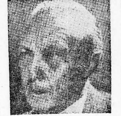
ADENAUER — nem felelős

hogy egyiptomi gazdáiktól minél többet kapjanak. Mindezen túlmenően lelkesen és szívesen is teszik és