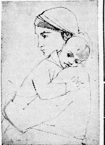
(Ruth Schloss rajza)

Ha viszont nem a munkahelyekhez, hanem a lakótelepekhez kapcsolva való-