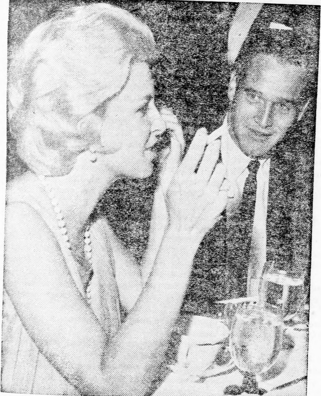
Joan Woodward és férje Paul Newman

Tony Perkins a napokban találkozott Walter Slezak filmszínésszel, aki 120 kilós. Tony ezt mondotta neki: „Le kell fogynod. Ez lehetetlen, hogy valaki ilyen kövér legyen. Nézz meg engem, hogy milyen karcsú vagyok. Tudod meg, hogy én erre nagyon vigyázok. Soha nem eszem a főétkezések közötti időkben. Ez a titka a soványságnak.” Slezak végigmérte Tonyt és ezt mondta: „Barátom, te úgy nézel ki, mint aki a főétkezések idején sem eszik.”