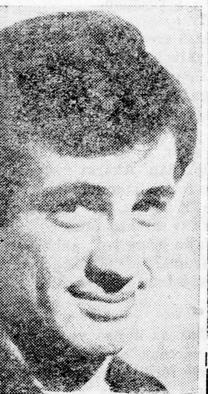
Jean Paul Belmondo