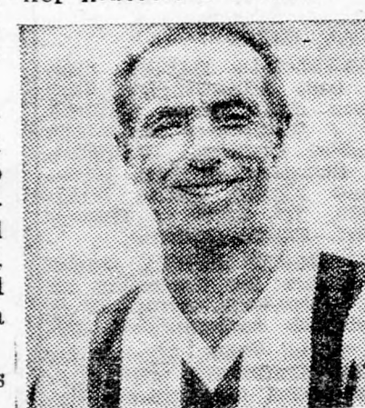
Az „Öreg varázsló”, akinek 11-estét Vizsker kivédte

Ez mind igaz, de egy sorsdöntő 11-est mégis eltölt és a jó érzékkel vetődő Vizsker kiütötte a labdát.