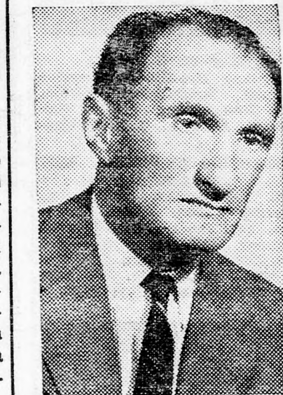
MANDI: „Sok sikert!”...

— Remélem nem igaz. Sohasem néztem klubérdeke-