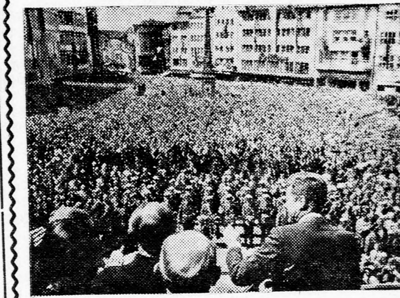
Bonn lakossága ünnepli az elnököt