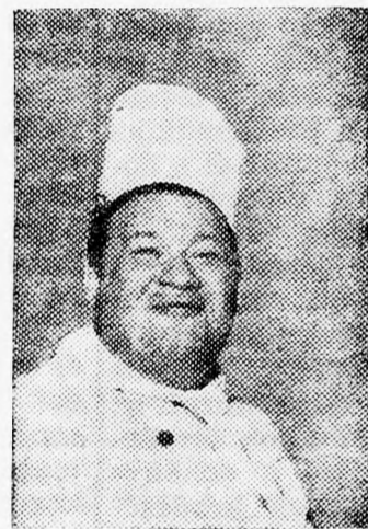
Az első bűvész