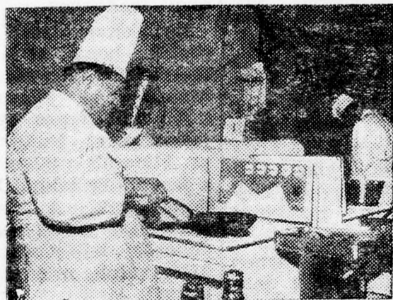
A két bűvész

Arról sem szabad megfeledkezni, hogy villanykészülékeken az étel természetes nedveiben fő és a vitaminérték teljes mértékben megmarad. Természetesen a konyhai munka is kellemes villannyal; kinyithatom az ablakokat, hogy léghuzatot teremtsék, anélkül, hogy kialudnának a lángok, nincs füst, nincs korom és az edények tiszták maradnak.