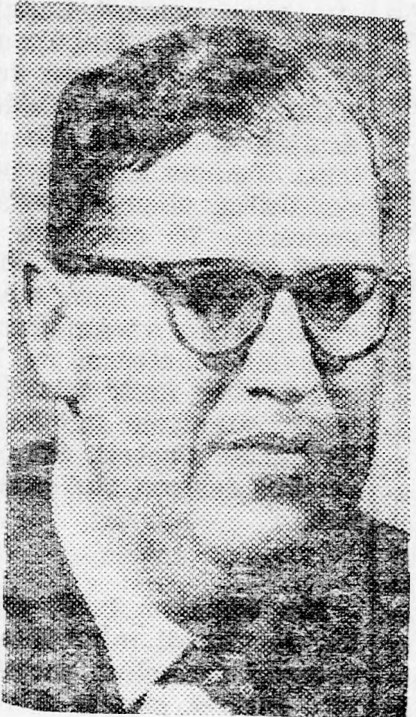
ABA EVEN elég volt a vitából...