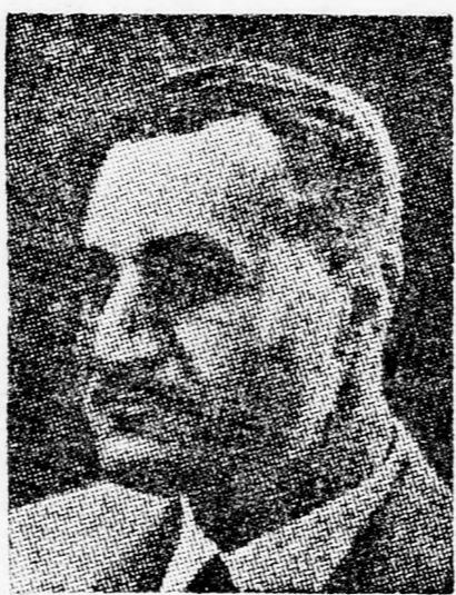
„Nehéz számomra az ünneplés . . .”

Ezért a szomorú helyzetért a Baat pártot terheli a felelősség, mint ahogy az ő bűnük az is, hogy megtorpedózták az új Egyesült Arab Köztársaság reményeit az arab világ egységének a létrehozására. Nem tagadhatjuk — mondotta