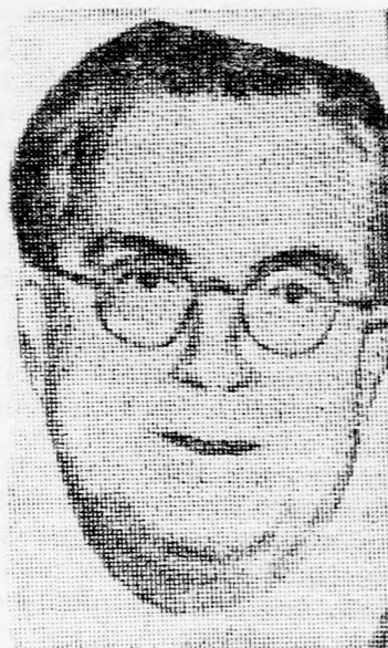
Dr. HANS GLOBKE

(Az eddigi orvosi megállapítások szerint az Adenovírus a felső légutak és a szem köthártyájának gyűjtő helye, valamint lázzal járó járványos megbetegedéseket okozó vírusok csoportja. — A szerk.)