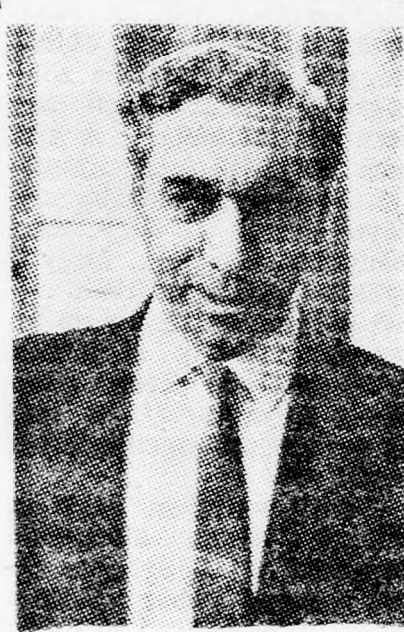
Abdul Nasser 27 lelkes hívet, akik a Baát párt megdöntésére irányuló puccskísérelt élén állottak.

annak a csehszlovák puszkákkal felszerelt kivégző osztagnak, amely a damaszkuszi börtön udvarán küldte a másvilágba Gamal