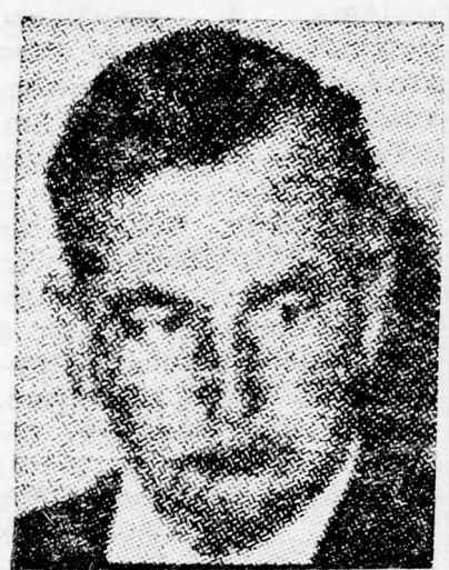
JOKLIK aki nem volt náci

A titkárno szintén mérnök és a rakétairányítás szakértője. Ő sebesült meg a Pilznek küldött robbanócsomagtól.