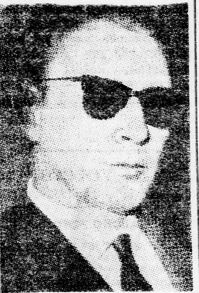
DR. WARD ki a hünes?

Vajon mit vesztené az angol és általában a nyugati demokrácia, ha dr. Stephen Ward „csontorvos” nevezetű perének tárgyalását zárt ajtók mögött folytatnák? Vagy ha legalább azokra a tanuvalloásokra rendelnék el a közbizonyosság elvitálását, amelyekből senki semmiféle tanulságot nem vonhat le.