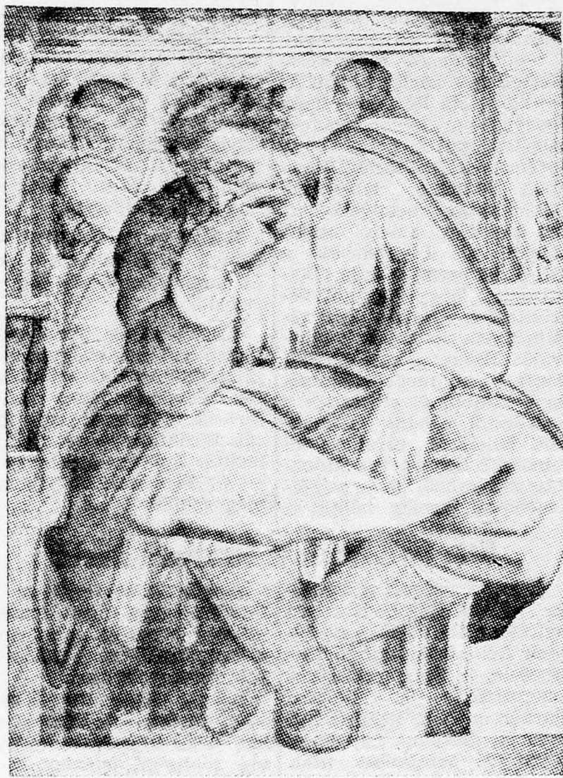
Michelangelo: JEREMIAS PRÓFETA

Égett a máglya a piac közepén, királyok, császárok új gőzérákat hoztak a zsidó ellen, hep-hepet kiáltott a falu kölyke, a zsidó meg várta a Messiást. Nem jött? Az se tudta az optimizmusát megtörni. Támadtak új bölcsek, akik új bitáchtot, reményt fecsekdéztek a nép lelkébe: „Hiszek, teljes hittel, a Messiás jövetelében, ha kérik is, annak ellenére minden nap várom érkezését.” Ezt Majmonides mondta, a nagy bölcse, a tizenhárom hitcikkelyében, amelynek például egyike, a második, így szól: „Hiszem teljes hittel, hogy a Teremtő, magasztaltassék a Ne-