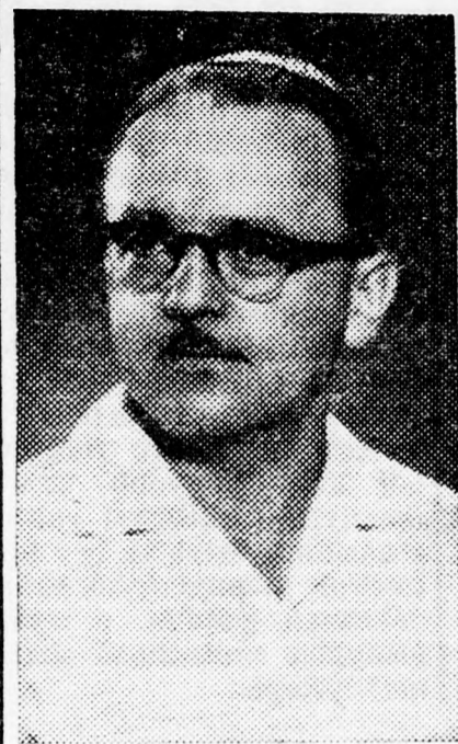
R A D Ó Nem rajtunk mulott...

Az országba visszatérve tavaly telepedett le Beér-