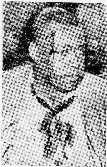
A multban így tüntettek...

donképpen egy láthatatlan ellenség, az amerikai társadalom belső rákfenéje, az újvilág legveszedelmesebb ötódi hadoszlópa, — az előítélet, a faji gyűlölet meg nyilvánulásai ellen kellett harcra szállani.