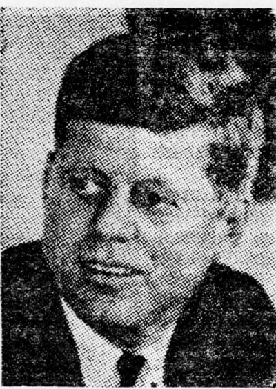
KENNEDY Uj idők

vezető, aki a mai washingtoni menetelés élén halad majd, legalább olyan erélyvel küzd a „fekete muzulmánok” nevű mozgalom ellen, mint Alabama, Geor-