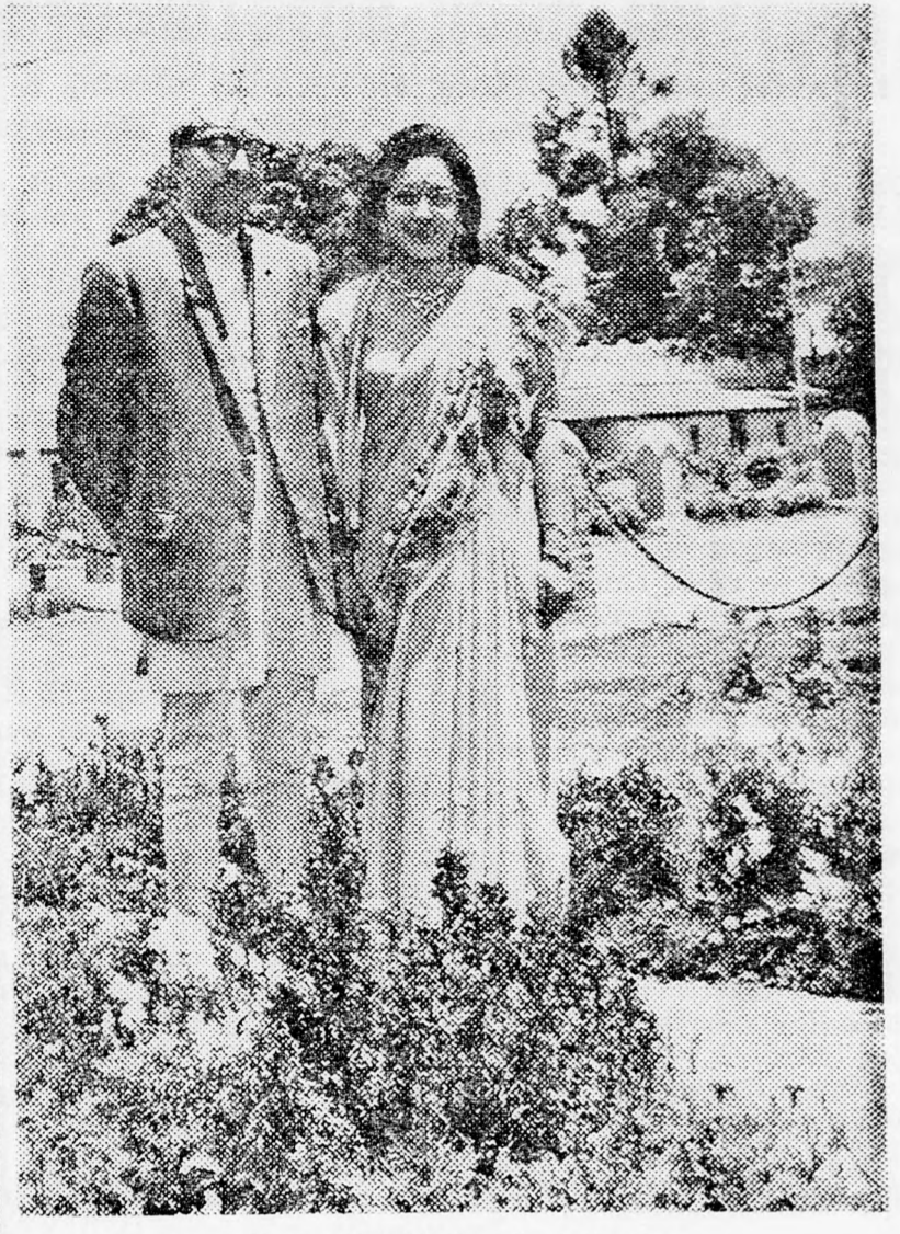
A nepáli király és felesége

A látogatás során Mahendra király meghívta Ben Guriont, hogy tegyen látogatást Nepálban. A volt miniszterelnök közölte, hogy szívesen elfogadja a meghívást, de Nepálba a maga részéről Kinán keresztül szeretne eljutni. Ez a megjegyzés ismételt arra utal, hogy Dávid Ben Gurion változatlanul kivételes fon-