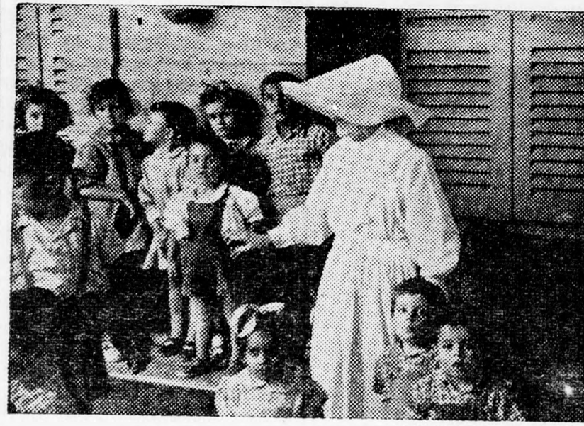
GYERMEKEK A MISSZIÓBAN

Ez itt a vezérkar, ez itt az idegközpont, amely az utasításokat és parancsokat kiadja az országos testület különböző csoportjai-