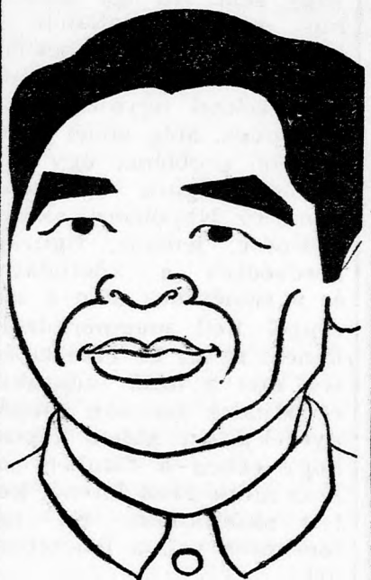
CSU EN-LAJ arccal az UNO felé...

a holnap világának az elárulását és éppen ezért le kell venni a fejről a népek háborújának a harcok veze-