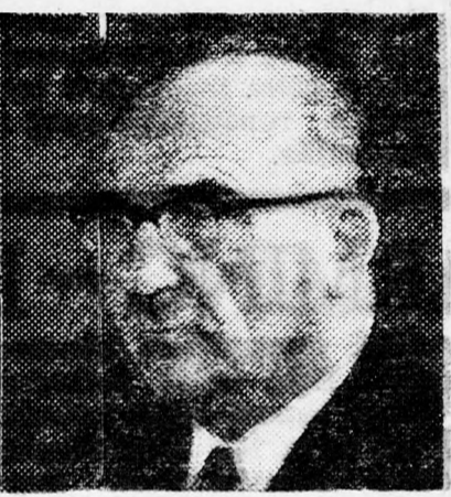
S. K O L az egy... az egység...

közötti együttműködésre vonatkozó tárgyalásokat is. Lehetséges, hogy a Lavon-csoporttal való kibékülés után az Achud Hávóda hajlandó lesz közös listán indulni a Mápájban a biztadruti választásokon, ami biztosítaná a két párt többiségét a szakszervezeti vezetőségben.