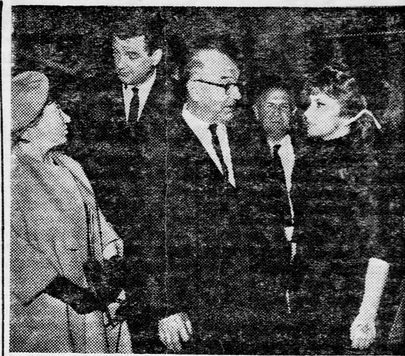
Lévi Eskol és Gna Lollobrigida, Mirjám Eskol és Rock Hudson az „Unversal” filmstúdióban