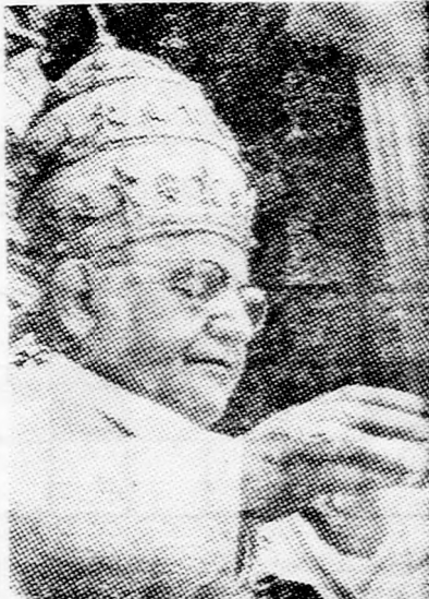
XXIII. JÁNOS Lesz-e folytatás?

Számunkra, a zsidóság részére nem sok jót ígér ez a zsinat. Egyre több jel mutat arra, hogy a Vatikán „visszakozik”, mert terbe vette, hogy megostyálja minden lényeges tartalmától az úgynevezett „Zsidó okirat”, amely a zsidóság elleni két évezredes vérvadát, Jézus keresztrefeszítésének történelmi „bűnét” volt hivatalosan lemosni róla.