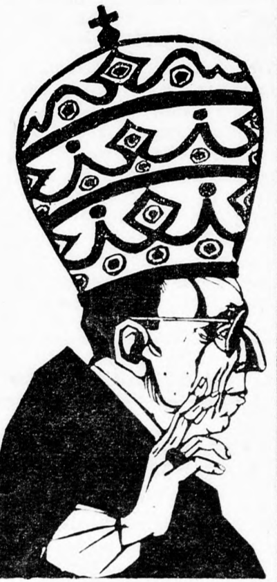
XII PIUS Szelleme most is kísért

★ A jelenlegi pápa ígéretet tett arra is, hogy teológusok és orvosok vizsgálják és tanulmányozzák a születésszabályozás és a terhesség megakadályozó gyógyszerek tudományos-erkölcsi-vallási kérdé-