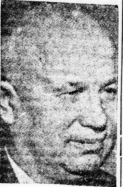
CHRUSCSEV Irányt szabott Kairóban

kenységét, amely fontos sikereket ért el és további lépést tett az arab népek egységének megerősítése felé. Az önvédelmi intézkedések foganatosításának az oka, hogy Izrael cészerői fenyegetések és provokációk nyilatkoznak meg.