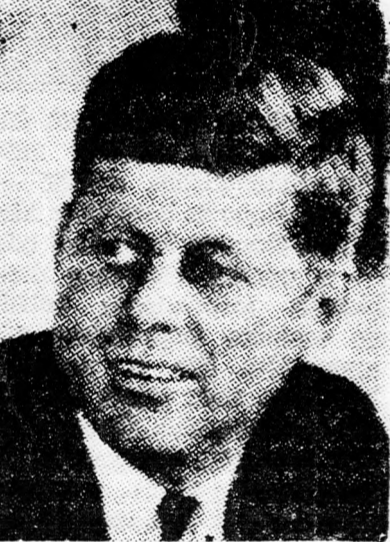
KENNEDY „Polgártársaim szerte a világon!”

Érdekes most arra visszaemlékezni, hogy az 1960-as elnökválasztási kampány idején a fran-