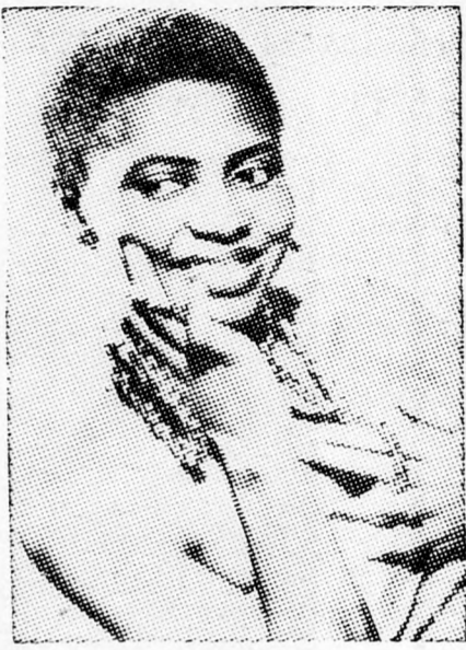
MIRJAM MAKÉBA Golda mindig telefonál.

Nemcsak művészetével, nemcsak lebilincselő hangkultúrájával, nemcsak megragadó sajátos egyéniségével, de egész világnézet-humánus tartásával is magával ragadja az embereket Mirjam Mákébá. Sötét arcánál kiragyogó vakító fehér fogai, duzzadt ajkai, — mind jellegzetes ismertetőjelei származásának, néger voltak.