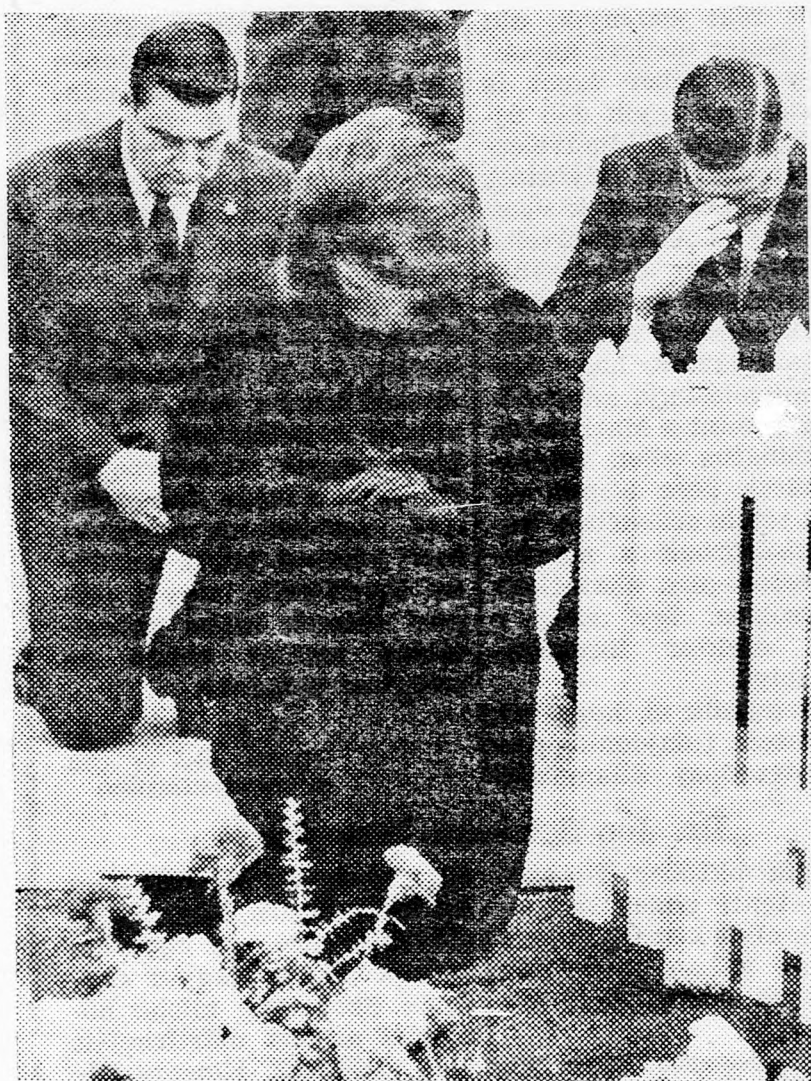
JACQUELINE FÉRJE SIRJANAL

És ez alatt Jacqueline Kennedy vértől áztatott ruhájában, valósággal önkívületi állapotban, az autó jobb hátsó felére ugrott, és amint azt utólag meg-