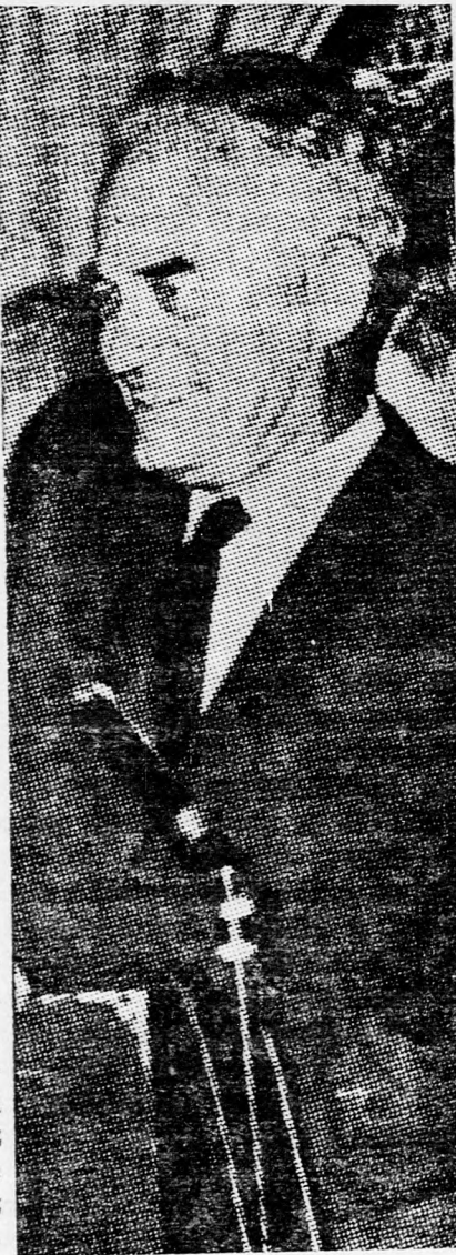
GOLDWATER Trumanra gondolok...

nagyobb tekintéllyel járó állásának a betöltéséért folyó versengésben a jelöltek minden elképzelhető érzelmi és racionális hirt-