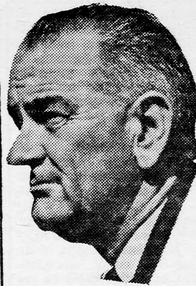
JOHNSON New-York-i zsebében...

Erre az elszigetelt esetre teszi összes lapjait és