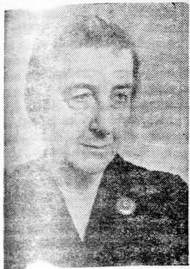
GOLDA MEIR Az „öreg” közbeszóló...

Az „új rend” hívei lehengerlő győzelmet arattak a Mápáj pártközpontjának ülésén. A központ 182 tagja megszavazta az „új rend” létrehozására vonatkozó javaslatot és ezzel újabb átütő kétségbevonhatatlan személyes győzelemhez jut-