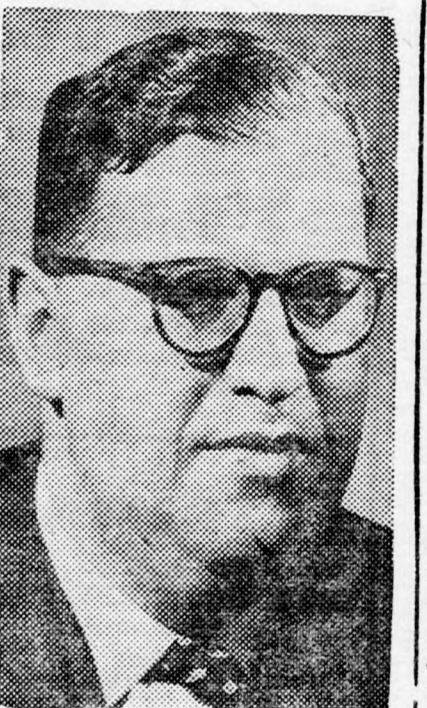
ABA EVEN „Muszáj betönni a füleket?”

Csak amikor a miniszteri hetesbizottság, s azon belül a Mápáj-miniszterek is, egyhangúlag , s a kétség árnyéka nélkül is, a legvilágosabb módon kimondta Lávon ártatlanságát és felmentette őt az ominózus utasítás kiadásának „bűne” alól, akkor, a következtetések megszavazása után fe-