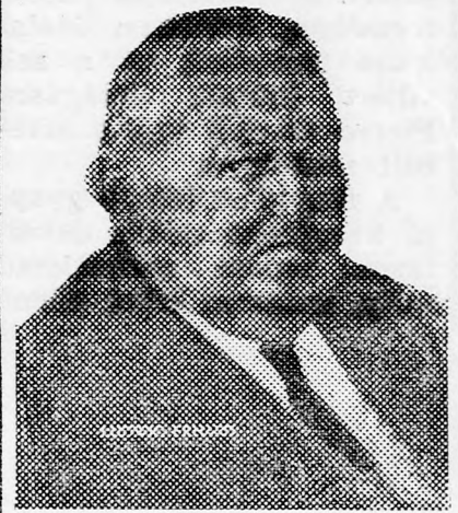
ERHARD Találkozó, de előbb...

ni kormány ezen ügyben tanúsított kétkulacos, két-színű politikáját, amely arra irányul, hogy elfelejtse Izraellel szembeni erkölcsi kötelezettségeit. Ugyan ezen pártkongresszuson azt