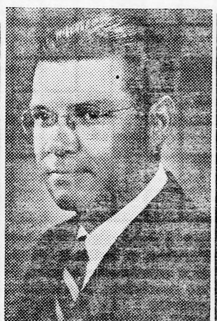
MACNAMARA A fizetés-emelések ellenére

ra, hogy Koszigin bejelentése az amerikai hadügyi költségvetés csökkentésére vonatkozólag nyilvánvalóan MacNamara amerikai had-