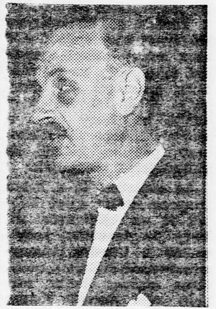
JIGÁL JADIN Az „öreg” embere?

mára a kormányon belül! Kiegyezésre, kompromisszumra hajlandó emberként vagyok ismeretes. Ez alkalommal azonban — nem fogok kompromisszumot tenni! Nem leszek a világ szemé-