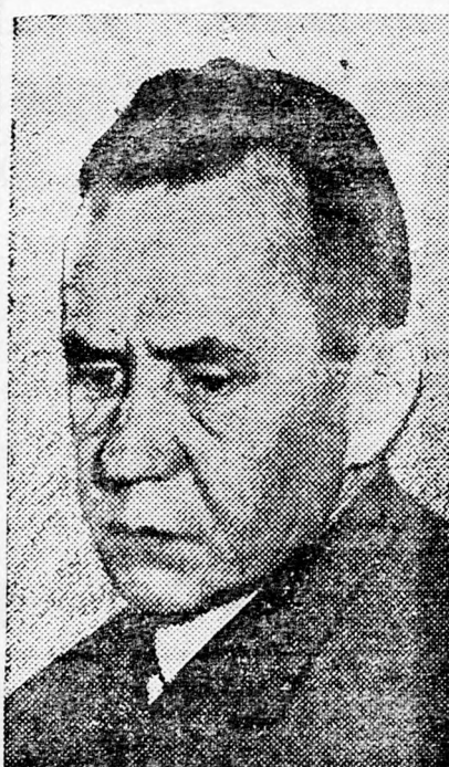
KOSZIGIN Ígéretet kaptunk...

Megjegyzés: A tel-avivi külön-buszon 4 IL-be kerül a buszjegy, a natanjai résztvevők 2.50 IL-ért utazhatnak oda-vissza.