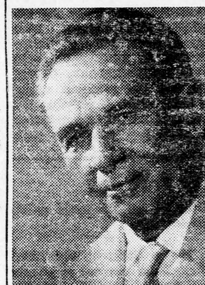
CHUSI Még egy távirat...

középiskolában, ahol a 900 növendéket számláló haifai egyetemi intézetet ideiglenesen elszállásolták, a mi-