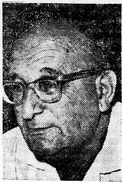
CHAJIM GVATI Az állatorvosok mindent ellenőriztek...

Nem világos e pillanatban, kit terhel a felelősség azért, hogy a fertőző állatokat behozták az országba. Az egyik érvelés