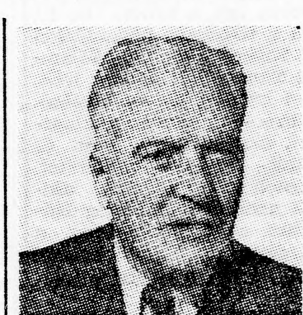
SITRIT „Megállítom az autóbust”