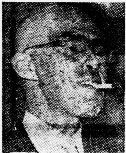
JISZRAEL BEER A figyelmeztetés ellenére...

és más pártok fórumain elhangzott kijelentésekből általános politikai viták rendezését provokálni. Ha a jövőt tekintjük magunk előtt, akkor a ma kérdéseivel kell foglalkoznunk, nem pedig szószálhasogató vizsgálódással a múlt felé