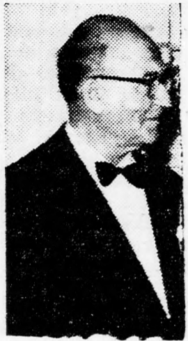
ESKOL Nem olvastam

„Mik azok „a nem rendben lévő dolgok” és miért hallgattok rólok Eskol évek hosszú során át, amikor Ben Gurionnak legbizalmasabb és legközelebb munkatársa volt. Meg kell kérdeznünk a miniszterelnöktől, mi nem volt rendben és ha tőle nem