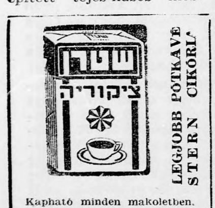
Kapható minden makoletben.