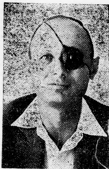
DAJAN: Ez nem program végős lépésre, a szakadásra.

érkezett és azonnal szót kért. Hosszasan fejtegette hajlíthatatlannak tűnő álláspontját, s elszántnak mutatkozott a