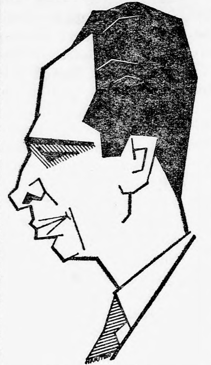
SIMON PERESZ „Nem akarok miniszterelnök lenni...”

lasztóival találkozok, akkor jelszavakba sűrítik — kénytelen-kelletlen — a programját. De a politikai gyakorlatban gyűlölem a frazeológiát. Ha egy párt nem akarja a németekkel való diplomáciai kapcsolatokat, azt mondja meg nyíltan. Ne szónokoljanak ellene, s aztán a parlamentben tartózkodjanak a szavazástól. Az életszínvonal leszállítását csak akkor vegyük be a pártprogramba, ha komolyan gondoljuk. Ha a takarékos életmód ellen vagyunk, azt is mondjuk ki bátran... — Ben Gurion is ilyen nyugati típusú demokrata, vagy inkább a kelet európai irányzat neveltje? — Kérem, én csak magamról beszélek... — Mi annak a lélektani háttere, hogy Ön tűzőnven kereszttül követi Ben Guriont? — Mert ő egy iskolát csinált és én hűséges maradtam az iskolához. Annak ellenére, hogy Ben Gurion koncepciója megbukott az Uj rendületben. Hogy a kongresszus szellemének, a küldöttek akaratának nem megfelelő formában alakult ki az együttműködés az Achdut Háadvóval. En azért maradtam Ben Gurionnal, mert célkitűzésem, hogy a következő politikai fordulóban győzedelmeskedjek a ben-gurioni koncepció.