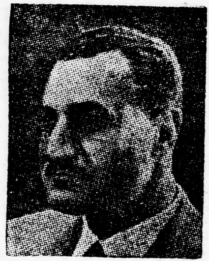
A „Muzulmán Testvériség” jobboldali vallási szervezet, amely konokul harcolt Nasszer ellen.

Hir szerint egy héttel ezelőtt kezdődtek a Kairótól mintegy 15 kilométer távolságra lévő Kerdasza elővárosban az összecsapások felfegyverzett lázadók és a katonai rendőrség között. Szombaton is folytatódott a zavargások. A Biztonsági Alakulatok Kijárási Tilalmát Rendelték el Kerdaszában, amely a „Muzulmán Testvériség” egyik erősségének számít. A parasztok csak akkor mehetnek ki a mezőre, ha előzőleg keresztül mentek már a katonai rendőrség nyomozásán. Az United Press International késő éjszakai jelentése szerint eddig már 600 személyt tartóztattak le a „Muzulmán Testvériség” tagjai közül. A hivatalos helyről megemelt információk szerint négy katonai rendőr vesztette életét és három pedig súlyosan megsebesült annak az összecsapásnál, amely a Kairó közelében lévő Kerdasza városkában ment végbe.