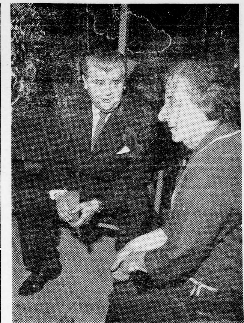
CHRISTEN PER HAEKKERUP ÉS GOLDA MEIR

Auriol egy délfranciaországi kisvárosban született és apja példáját követve minden bizonnyal pékmester lett volna belőle, ha 4 éves korában nem érte volna baleset. Egy puskagolyó, amelyet nagyapjától kapott, felrobbant és kilötte balszemét. Ezért szülei elhatározták, hogy taníttatni fogják az egyetemen, ahol jogi és filozófiai doktorátust szerzett, feltűnést kelte tehetségével. Már diákkorában harcos szocialista lett és elvállalta a Midi Socialiste napilap szerkesztését Toulousban, ahol később ügyvédi irodát nyitott. Közvetlenül az első világháború kitörése előtt került be a parlamentbe és annak 1940. évi összeomlásáig tagja maradt. Leon Blum kabinetjében 1936-ban pénzügyminiszter és a 38-as Blum kabinetben a miniszterelnökséghez beosztott államminiszter volt, közben pedig Camille Chau-