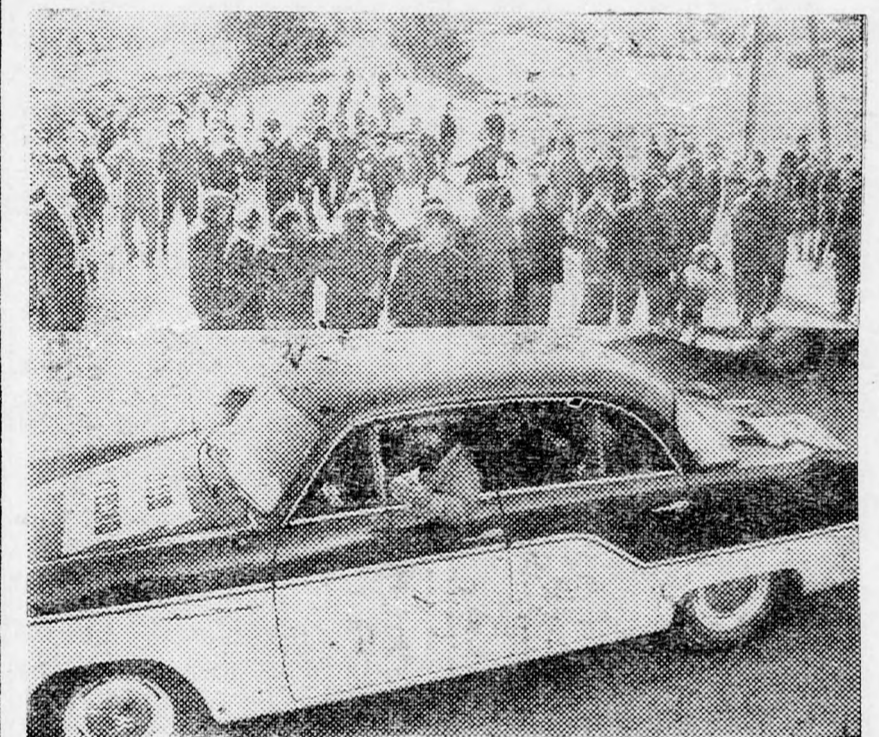
Betört ablakú autó, táncoló vallásosok

számos szimpatizánsa lakik, majd miután a sebesülteket bekötötték és arendőrség