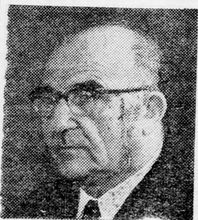
LÉVI ESKOL utolsó simítások az új kormánylistán

Ezt az állami funkciót ugyanis a jövőben, jelentőségének megfelelően, mint minisztériumi főosztályt vagy a közlekedésügyi, vagy pedig a keres-