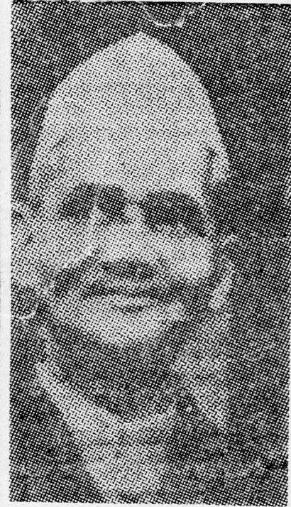
SASZTRI a „kis ember”

Az esélyes miniszterelnökök között említik Yeshwantrao Chavan hadügyminisztert, aki '962 óta, Krisna Menon menesztése után vette át a hadügyminisztériumot. Az 52 éves Chavan hadügyminiszter különböző jelentések szerint a legvalószínűbbnek tűnő személyiség a kormányfői tisztség átvételére.