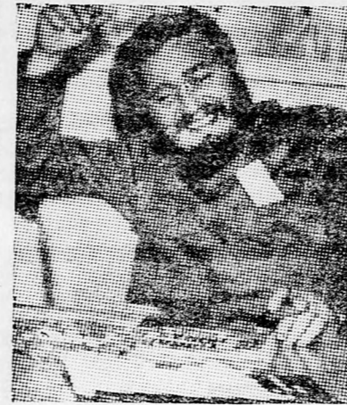
FIDEL CASTRO Önkéntesek mindenhová

készítő bizottságának elnöke. Castro bejelentette, hogy a kubai kommunista párt külügyi bizottságának elnöke,