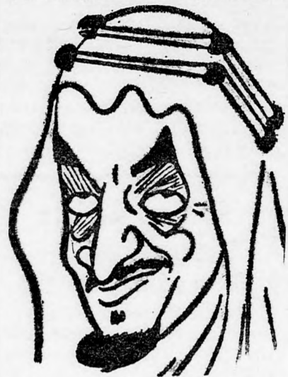
FEJSZÁL Muzulmán egység minden áron

magát, hogy haderőt tart a Közel Keleten a reakciók szövetségének megvédésére,