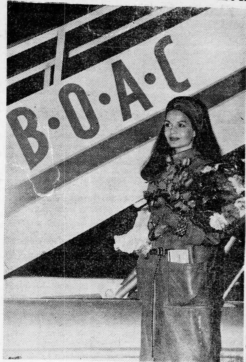
BARTÓK ÉVA LUDDON

Bartók Éva, a világhírű magyar származású filmszínésznő tegnap este az országba érkezett, hogy a Sabina című film főszerepét eljátsza. A film Margot Klausner stúdiójában készült, Peter Freystadt rendezésében.