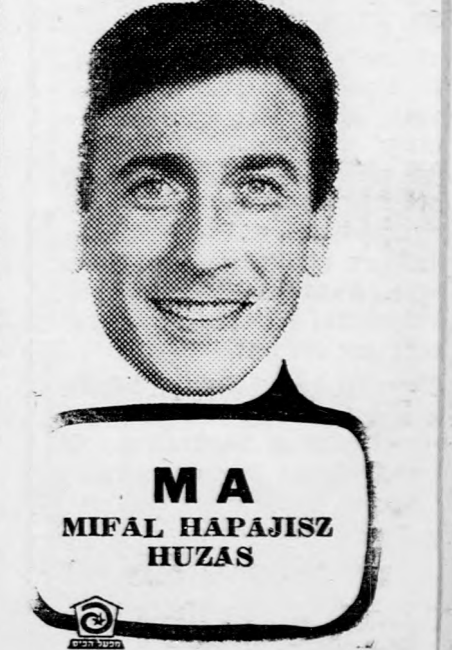
MA MIFAL HAPAJISZ HUZAS