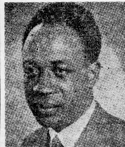
NKRUMA közel az elvesztett hazához

elő is, mert Szeku Turé elnök „nagyfontosságú beszédét” jelezték a hatóságok.