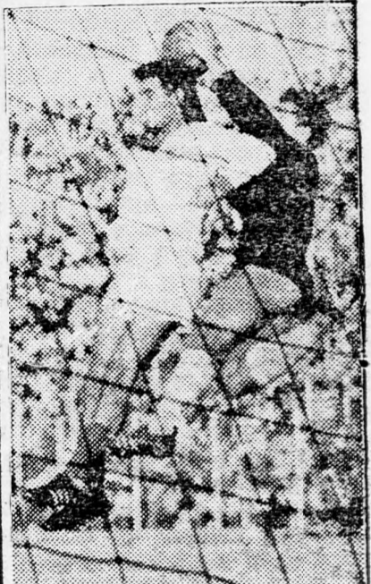
Bochusz (Makkábi Jaffa) és Elkájám (Hápoel Tel-Aviv) légiestája

Az április elsején megjelenő kérdőívet, mint fentebb részleteztük, a tippelőnek ki kell vágnia, és kitöltve — a 12 szelvényel együtt — az Uj Kelet szerkesztőségéhez beküldeni a következő címre: