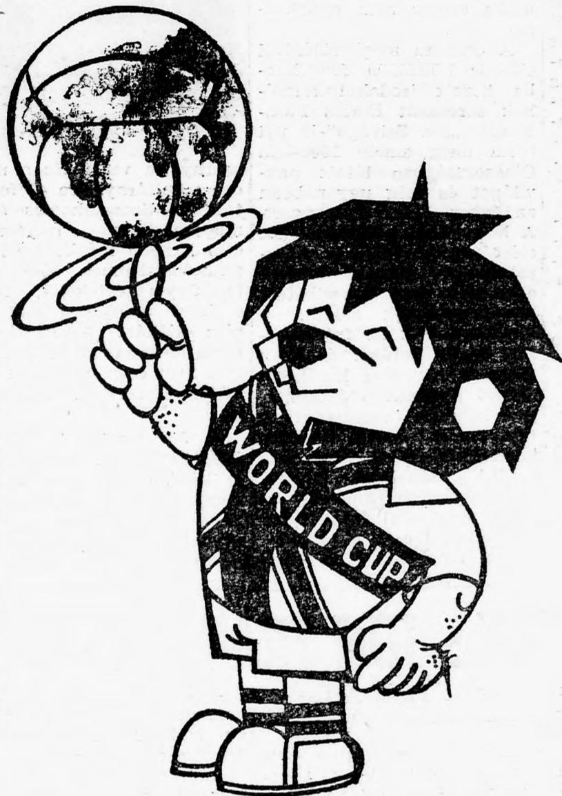
A világbajnokság karikatúrizált figurája, (ahogyan azt egy budapesti rajzoló látja)