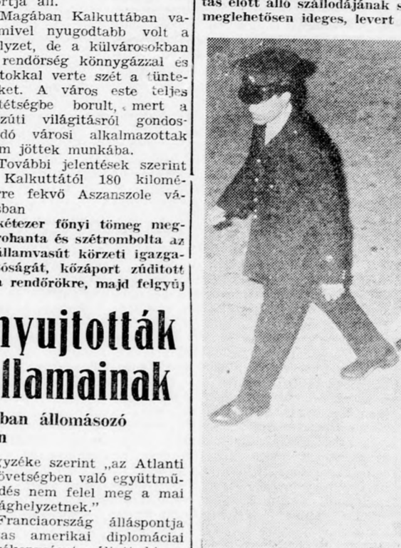
Verges kíséri a távozó repülőgéphez. Verges kíséri a távozó repülőgéphez. Verges kíséri a távozó repülőgéphez.