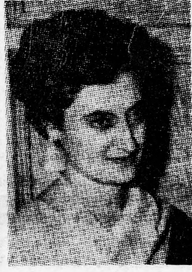
INDIRA GANDHI Segélykérés Washingtonban

New Delhi, (UPI, Reuter). — Indira Gandhi asszony, India miniszterelnöke e hó végén látogatást tesz Washingtonban. Az indiai miniszterelnök útnak különös jelentőséget kölcsönöz az a tény, hogy országát súlyos gazdasági válság sújtja és az élelmiszerhiány, az éhinség, a pundzsábi nyelv körüli belső háboruszkodás pedig a belső válság súlyos problémáit állítja Indira Gandhi elé. Jellemző az indiai helyzetre, hogy számos gyárvalalat nyersanyaghiány miatt leállította a munkát, miközben az április elsején meginduló új négyéves terv egész sorsa és sikere kétségessé vált, ha nem sikerül időközben jelentős pénzügyi gazdasági támogatást szerezni Indiának külföldi forrásokból. A többi között ezt a célt szolgálja Indira Gandhi amerikai útja. Az Egyesült Államok és számos más ország jelentős mennyiségű élelmiszert küld Indiába az éhinség veszélyének elhárítására, de az idén különösen súlyos a helyzet a monszunesők elmaradása miatt, és így komoly élelmiszerhiány várható. Valószínű, hogy az ellenzéki pártok a jövő februárban esedékes választások alkalmával