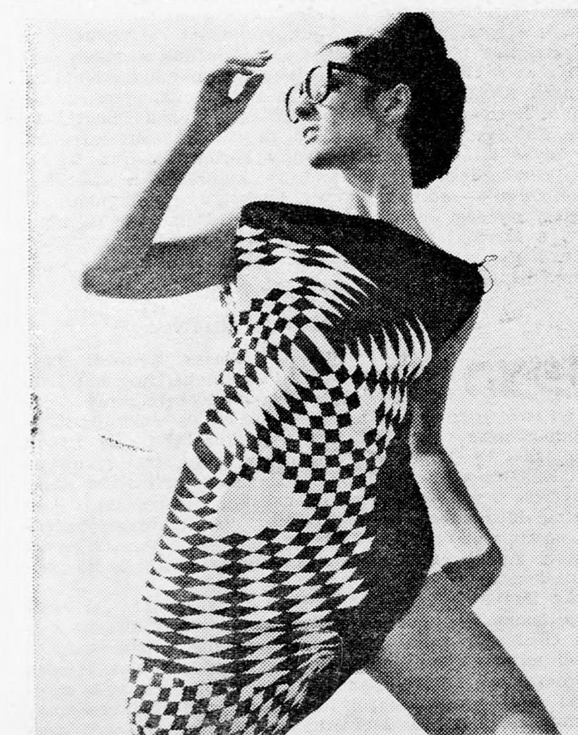
Képeslapunk Milánóból érkezett, pontosan a Veneziánidivatházból. Ez is egy OP-ART modellt ábrázol.

Rajzunkon boleróval kiegészített ujjatlan ruha modelljét közöljük. Az együttes sakkmintás vagy síma anyagból készülhet — ha sötétkék, úgy fehér szegéllyel, gombokkal és zsebkéssel, ez esetben a köralakú gallér is fehér lehet. Fehérhez — fiatalok részére a piros-sötétkék szegélyezés divatos és érdekes.