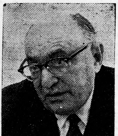
SAZÁR ELNÖK Sértő magatartás Delhiben

az elnök, az ott üzemanyagot felvevő repülőgépet elhagyhatta. Katmandu (LI). — Zálmán Szászár államelnök ma, hétfőn délelőtt megszemlélte az a nagyszabású katonai bemutatót, amelyet Katmanduban, Nepal fővárosában rendeznek. Ennek keretében ejtőernyős gyakorlatokat hajtanak végre azok a nepáli katonák (Folytatás a 8. oldalon)