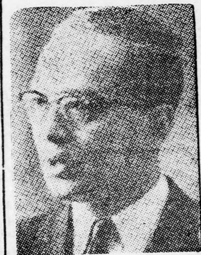
U TANT Anglia is mérlegel...

volna az olaj kiszivattyúzását. Egyelőre még nem ismeretes mi lesz a sorsa. A kikötőben úgy nyilatkoztak, hogy a „Johanna 5” a dagály miatt az éjszaka még sem-