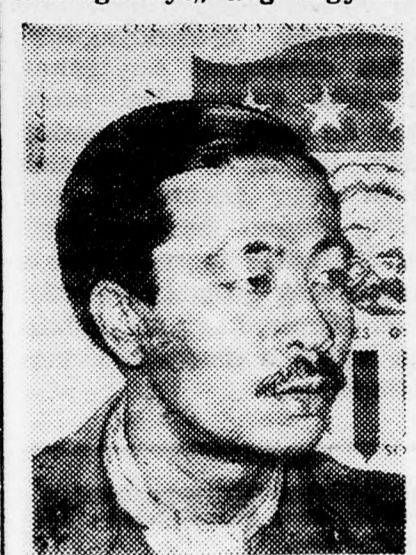
NGUJEN CAO KI Civilek előnyben...

francia tiszti kiképzőben tanult, és annak elvégzése után hadnagy lett. A franciák később az észak-afrikai Marokkóba küldték, ahol repülő-kiképzést kapott. 1954 szeptemberében kapta meg a pilótaengedélyt, alig négy hó-