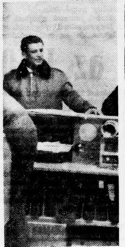
ABIE „Tárgyalni akarok...”

— A puskacsó előtt álló ember szempontjából az amerikai golyó éppúgy fáj, mint az orosz, és egyáltalán, ki akarja megtámadni Jordániát — mondta a new-yorki repülőtéren az újságírók előtt.