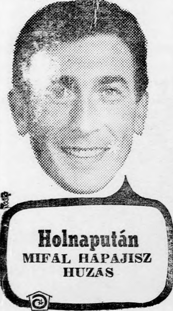
Holnapután MIFAL HAPAJISZ HUZAS

közöttük számos francia, olasz, belga, holland, görög és skandináv résztvevő. A felvonulás három nappal ezelőtt kezdődött, a tüntetők ötven kilométeres gyaloglás után vonultak be a londoni Trafalgar térre.